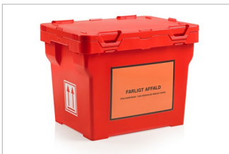
Klistermærke "Færligt affald" ikke inkluderet.