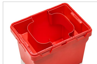
Batteriboks (Tilgængeligt tilbehør)