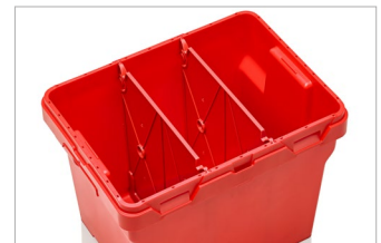
Skillevæg (Tilgængeligt tilbehør)